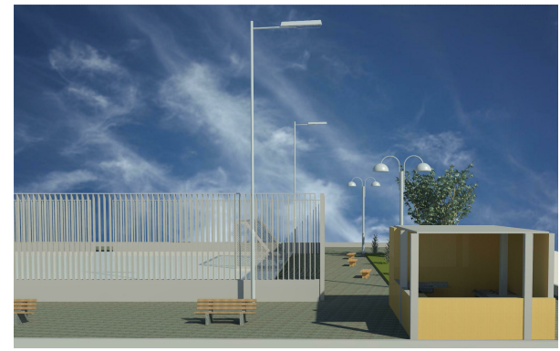
5 QUIOSQUE 1: 1