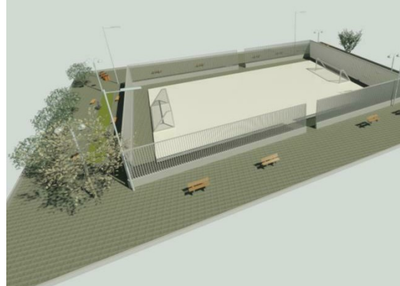
4 VISTA ITAPICURU 1: 1